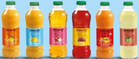
Orange Ananas Pomme Cranberry Multifruits Citron vert